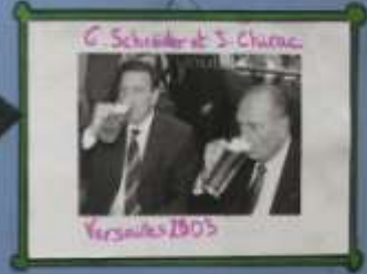
G. Schröder & J. Chirac