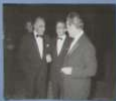
Photo de Louis Luchmann. Cette photo a été prise à l'Élysée, à Paris, le 21 janvier 1969. Elle montre Pompidou et Brandt en train de discuter. Pompidou est à gauche, Brandt à droite. Ils sont tous deux en costume et cravate. La photo a été prise par Louis Luchmann, un photographe allemand.