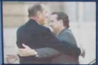
Chirac wagt sich Schröder & Thilo in Paris 2005

Text block with German text, likely a summary or introduction to the relationship between Schröder and Chirac.