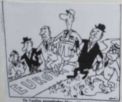
De Gaulles europäischer Weg, nicht miteinander, sondern nebeneinander

Cette caricature a été faite par E&K après la conférence de presse du 7 septembre 1962, où le général de Gaulle est accusé de rejeter le vote de la réglementation pour unifier l'Europe et développer sa conception d'une Europe des États.