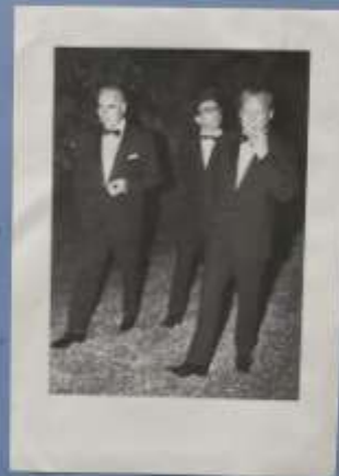
Photo de Louis Luchmann. Cette photo a été prise à l'Élysée, à Paris, le 21 janvier 1969. Elle montre Pompidou et Brandt en train de discuter. Pompidou est à gauche, Brandt à droite. Ils sont tous deux en costume et cravate. La photo a été prise par Louis Luchmann, un photographe allemand.